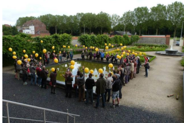
Événement artistique à Choiseul (CPAS)