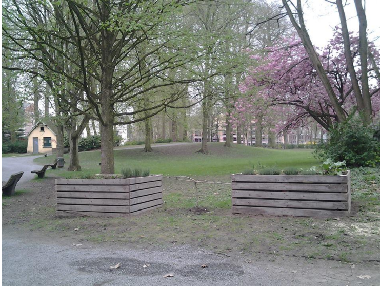
Bacs à aromates Jardin de la Reine