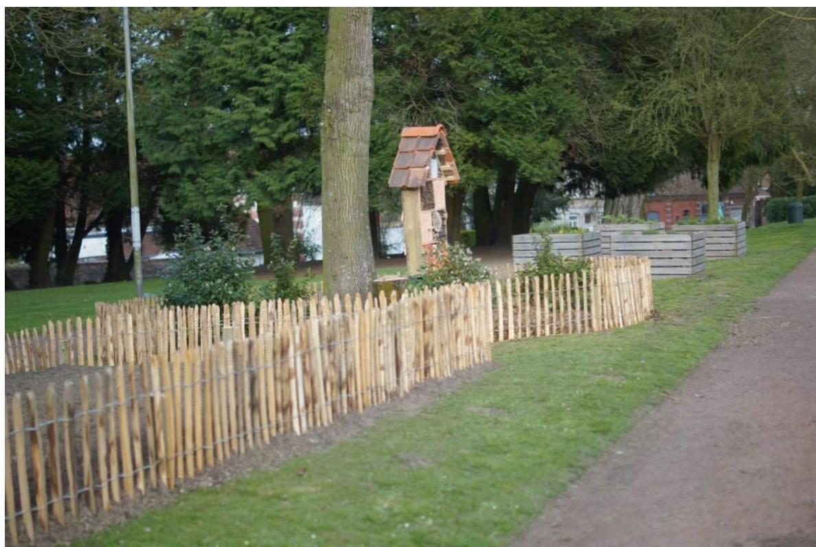
Square Marie-Louise St Piat