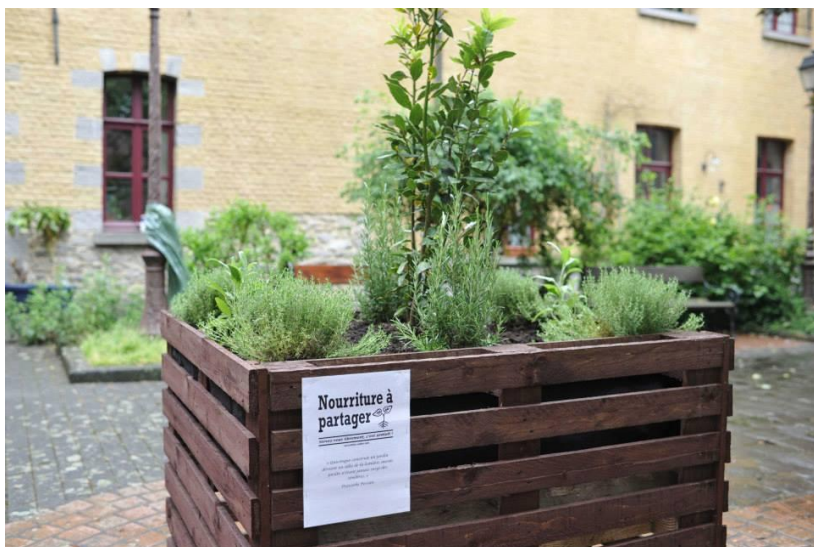
Rue des sœurs de charité