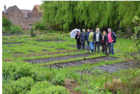
Potager collectif séminaire st piat