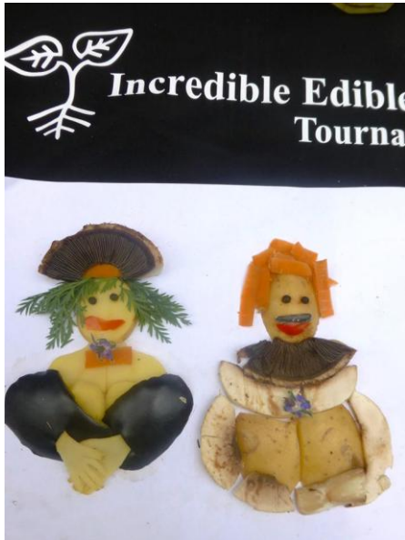
Sculpture légumes Tournai-lez-bains